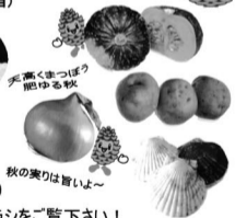
天高くまつぼろ 肥ゆる秋