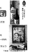
「馬喰一代」の映画ポスターと地酒「馬喰一代」

7月号で紹介した給水生花苑の住所と電話番号が誤っておりました。正しくは、「東町・住 42-3227」です。ご迷惑をおかけいたしました。